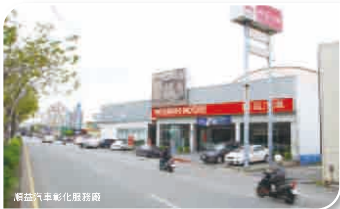
順益汽車彰化服務廠