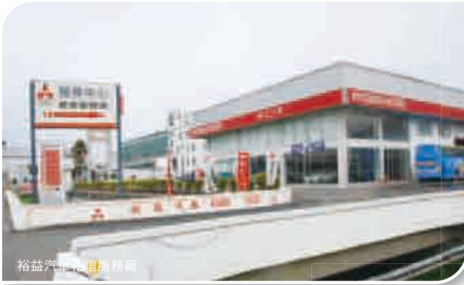
裕益汽車花壇服務廠