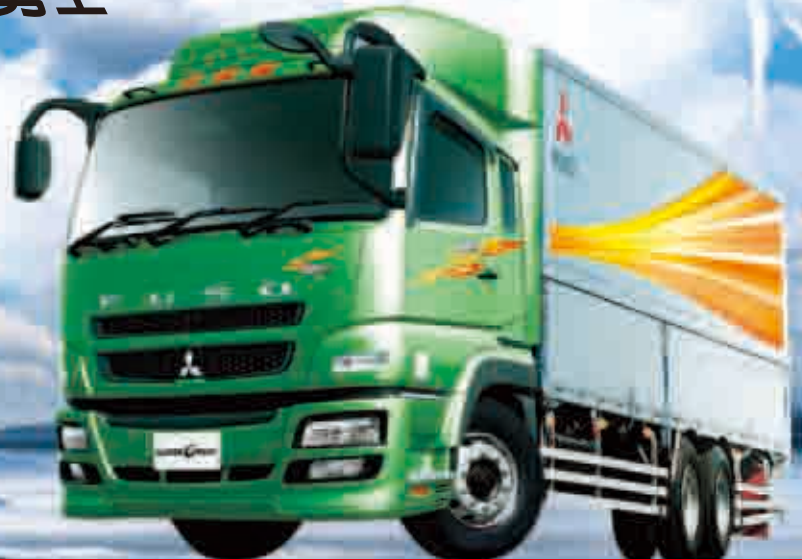
本圖為攝影仕樣車